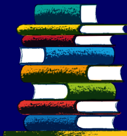
ill. Guido Scarabottolo